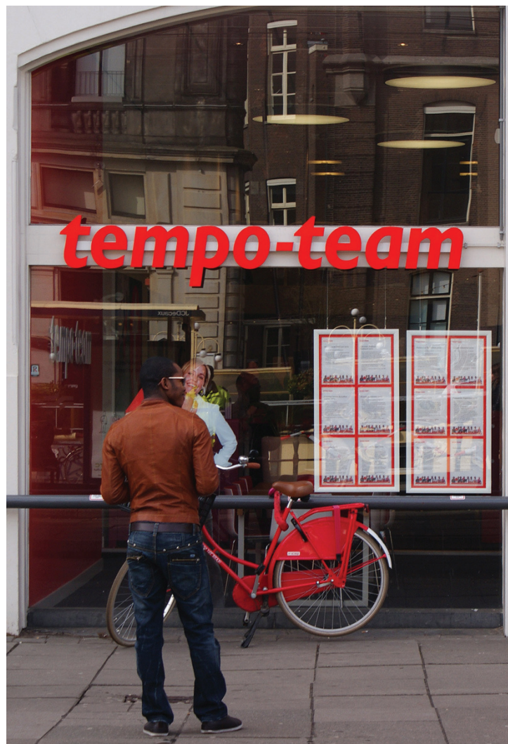
Tijdelijk werk is voor 'kwetsbare groepen' niet automatisch een zegen

Op basis van dit onderzoek lijkt de belofte van een flexibele arbeidsmarkt: minder baan zekerheid maar meer werkzekerheid dus een valse. Het gebrek aan baan zekerheid van tijdelijk werk wordt gemiddeld niet of nauwelijks gecompenseerd door meer werkzekerheid in de zin van een kortere werkloosheidsduur. Verder valt te vrezen dat de positieve effecten (doorstroom naar vast werk) van tijdelijk werk voornamelijk te vinden zijn bij werkenden die toch al een gunstige arbeidsmarktpositie hebben en dat de negatieve effecten (vaker werkloos) voornamelijk gelden voor diegenen met een minder florissant perspectief. Tijdelijk werk is dus voor 'kwetsbare groepen' niet automatisch een zegen.